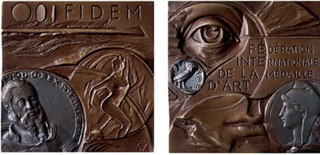
Nr. 3. De FIDEM-penning, 100x100 mm, brons, 2025. Anna Wątróbska-Wdowiarska.