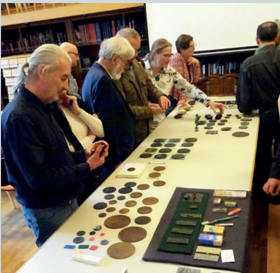
Nr. 1. Penningmarkt in de bibliotheek van het munt- en penningkabinet te München.