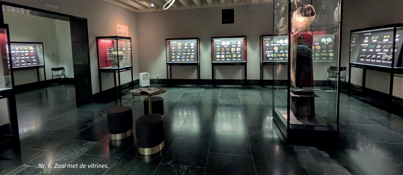
Nr. 6. Zaal met de vitrines.