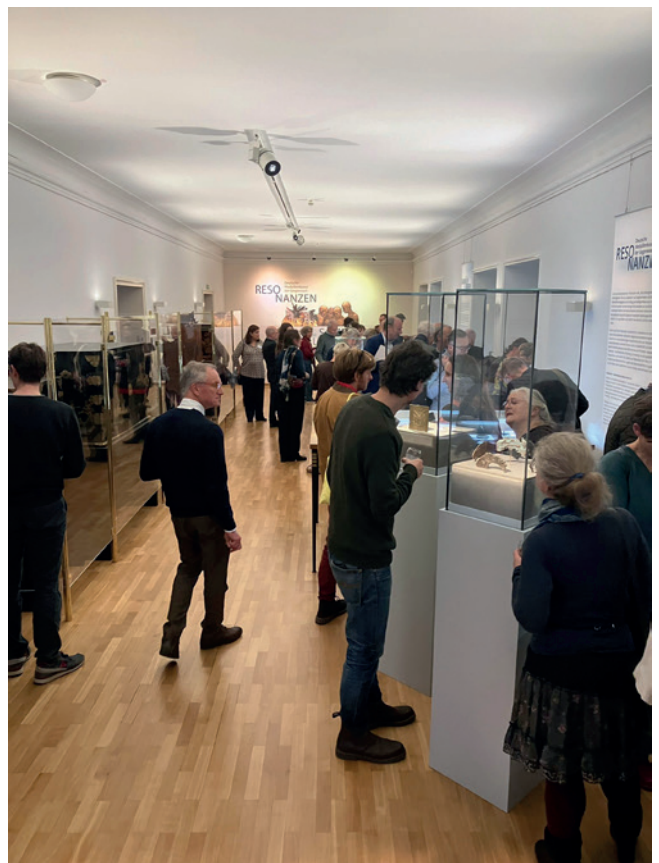
Nr. 8. Resonanzen was te zien in het munt- en penningkabinet van München.