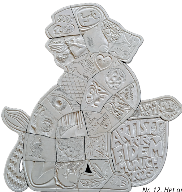
Nr. 12. Het grote gipsreliëf.