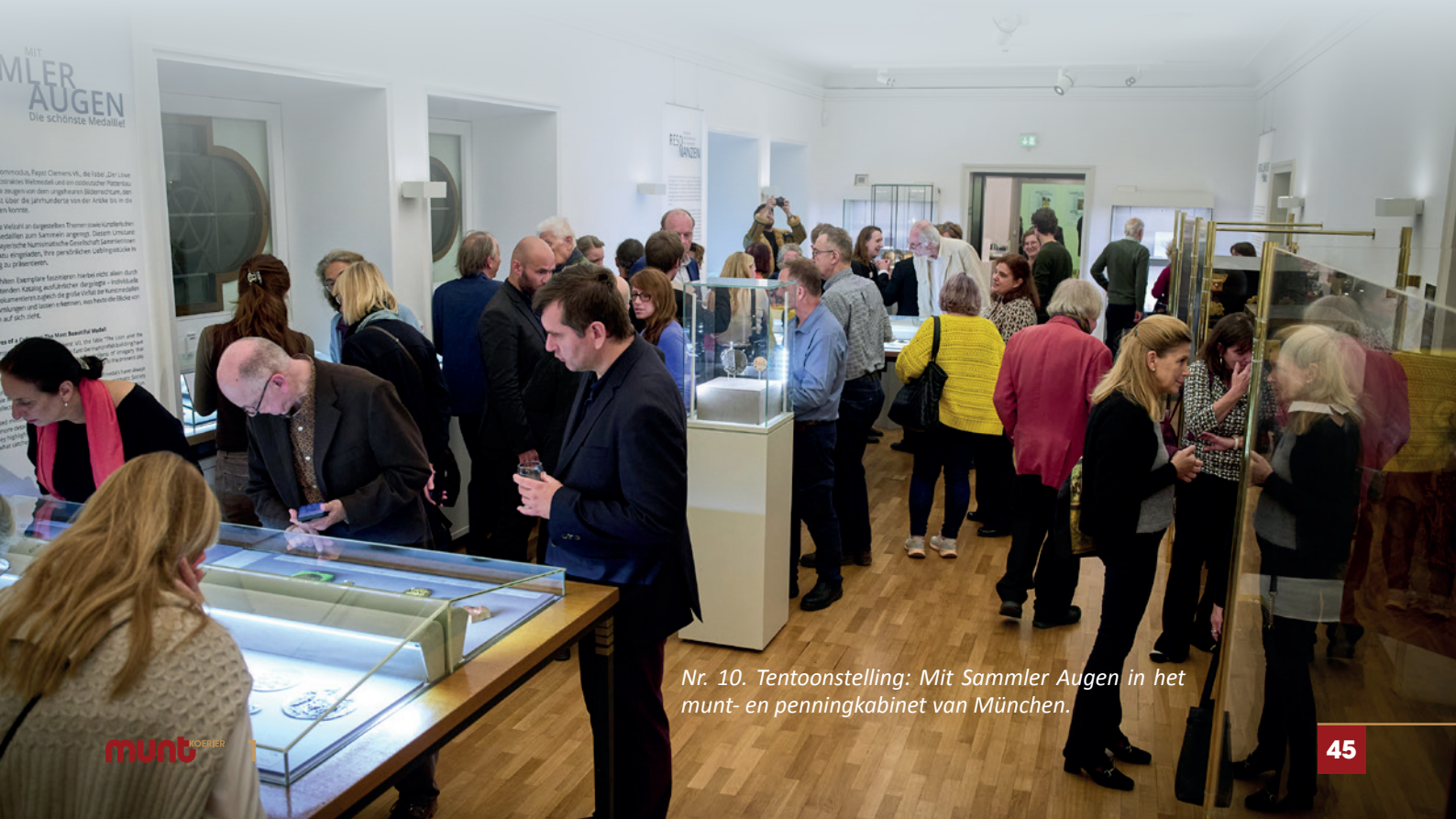
Nr. 10. Tentoonstelling: Mit Sammler Augen in het munt- en penningkabinet van München.

Er was een extra tentoonstelling georganiseerd van de mooiste penningen uit privécollecties. 75 penningen werden in het muntkabinet tentoongesteld, geselecteerd op artistieke kwaliteiten (afb. 10). De presentatie gaf een overzicht wat de verzamelaar aanspreekt. Veel kunstenaars, tijdperken en thema's kwamen aan bod. (Die tentoonstelling had ik graag willen zien.)